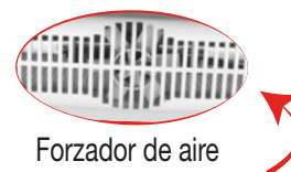
Forzador de aire

No deje el equipo funcionando o conectado sin custodia, o expuesto al aire libre o ventanas para evitar que perturbaciones atmosféricas puedan cambiar las condiciones de funcionamiento y crear riesgos de carácter eléctrico o incendio.