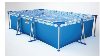
TODA LA VUELTA

Armado la pileta como lo indica el instructivo y verterle agua hasta un nivel de 2 cm. Acomodar todas las piezas correctamente y hacer que la distancia entre el regatón y el lateral del contenedor sea similar toda la vuelta, como lo indican las fotos. Terminar de llenar con agua hasta el comienzo de la soldadura superior en el lateral del contenedor, y... ¡Disfrutá de tu Pelopincho!