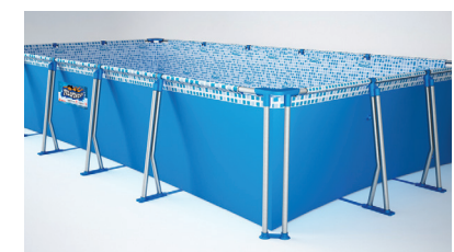
TODA LA VUELTA

Armado la pileta como lo indica el instructivo y verterle agua hasta un nivel de 2 cm. Acomodar todas las piezas correctamente y hacer que la distancia entre el regatón y el lateral del contenedor sea similar toda la vuelta, como lo indican las fotos. Terminar de llenar con agua hasta el comienzo de la soldadura superior en el lateral del contenedor, y... ¡Disfrutá de tu Pelopincho!