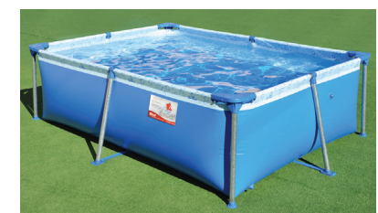
TODA LA VUELTA

Armado la pileta como lo indica el instructivo y verterle agua hasta un nivel de 2 cm. Acomodar todas las piezas correctamente y hacer que la distancia entre el regatón y el lateral del contenedor sea similar toda la vuelta, como lo indican las fotos. Terminar de llenar con agua hasta el comienzo de la soldadura superior en el lateral del contenedor, y... ¡Disfrutá de tu Tiburoncito!