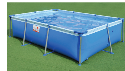
TODA LA VUELTA

Armado la pileta como lo indica el instructivo y verterle agua hasta un nivel de 2 cm. Acomodar todas las piezas correctamente y hacer que la distancia entre el regatón y el lateral del contenedor sea similar toda la vuelta, como lo indican las fotos. Terminar de llenar con agua hasta el comienzo de la soldadura superior en el lateral del contenedor, y... ¡Disfrutá de tu Tiburoncito!